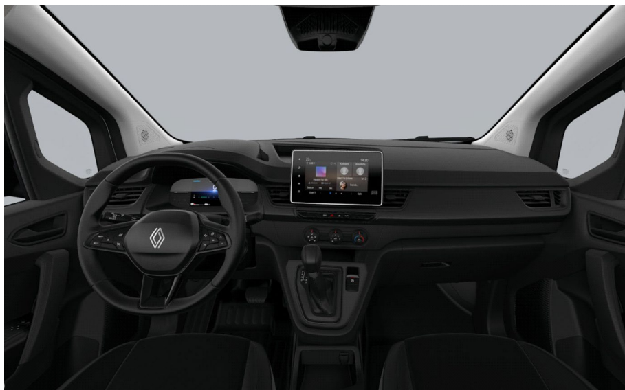
Πίνακας οργάνων οδηγού με οθόνη TFT 7" & σύστημα πολυμέσων με ψηφιακή οθόνη 8"