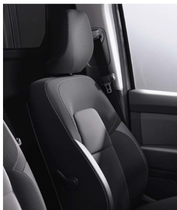
Υφασμάτινες επενδύσεις καθισμάτων σε μαύρο/γκρι χρώμα