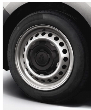
Τροχοί 16" & ελαστικά 205/60 R16