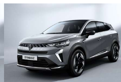
Γκρι Rafale (1)