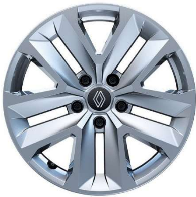
17" Nymphaea καλύμματα τροχών

S=standard, O=optional, -=μη διαθέσιμο Οι τιμές δεν περιλαμβάνουν φόρους και τέλη