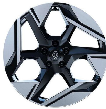
19" ζάντες αλουμινίου Pulsar