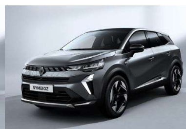
Γκρι Cassiope (2)