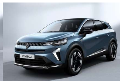
Μπλε Mercure (2)