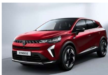
Κόκκινο Flame (2)