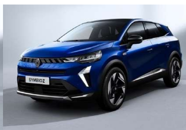
Μπλε Iron (2)