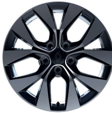
17" ζάντες αλουμινίου Diamantées Eridis