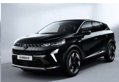
Μαύρο Etoile (2)