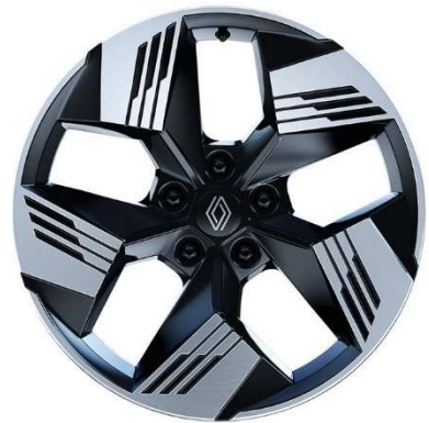
18" ζάντες αλουμινίου Gravity