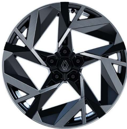
19" ζάντες αλουμινίου Elixir