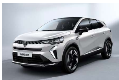
Λευκό Nacre (2)

Οι τιμές δεν περιλαμβάνουν φόρους και τέλη