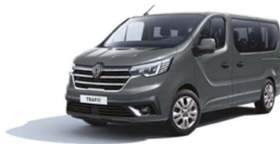
Γκρι Urban (2)