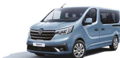
Μπλε Cumulus (2)