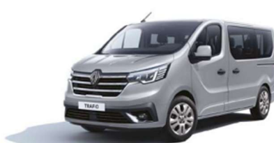
Γκρι Highland (2)